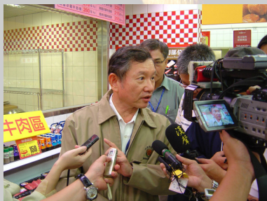
北區食品衛生特派員接受媒體採訪