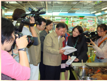
中區食品衛生特派員查訪大賣場