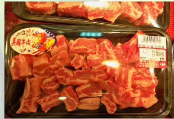
南區食品衛生特派員稽查小包裝牛肉標示情形