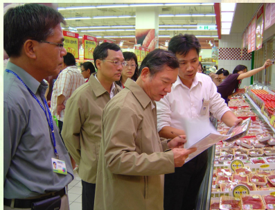
北區食品衛生特派員會同地方衛生局稽查員實地查訪大賣場