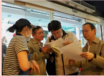
南區食品衛生特派員會同衛生局稽查員實地查訪漢堡店檢視輸入及檢疫相關文件