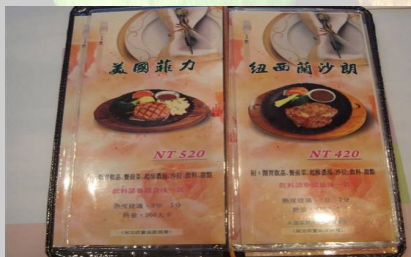
北區食品衛生特派員查訪餐廳菜單標示情形