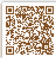
化粧品產品登錄 平台系統-民眾查詢

民眾選購化粧品時，除了可從產品外包裝標示內容（例如：用途、用法及保存方法、全成分名稱、使用注意事項、有效期間等）瞭解產品相關資訊外，也能透過「化粧品產品登錄平台系統-民眾查詢」查詢化粧品資訊，只要輸入中文品名、業者名稱、縣市別等資訊，即可知道化粧品是否有合法登錄，和業者登錄產品之完整資訊。