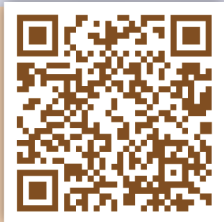
化粧品產品 登錄平台系統