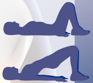
凱格爾運動示意圖▲

食藥署提醒，用於改善尿失禁之非侵入式刺激器屬於醫療器材，上市前須申請查驗登記取得許可證，始得輸入或製造。如需查詢