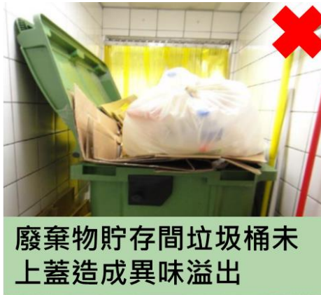
垃圾桶廢棄物清除後直接使用易孳生病媒