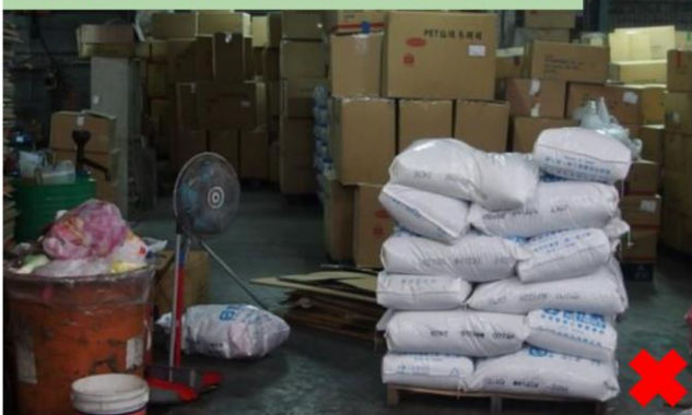
食品作業場所四周、倉庫內放置廢棄物