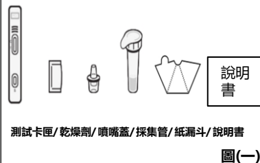
測試卡匣/乾燥劑/噴嘴蓋/採集管/紙漏斗/說明書