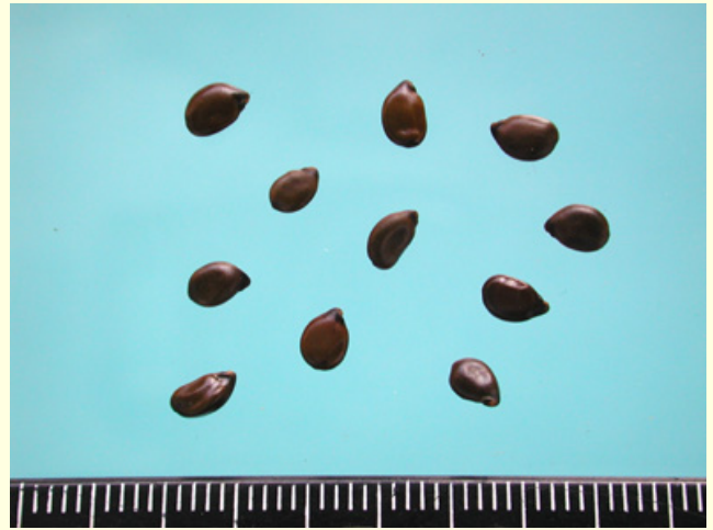
【誤用品二】：大花黃槐