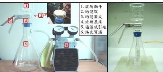
圖二、水檢體過濾裝置 圖三、檢液收集裝置

取檢體 100~1000 mL，加入氯化鎂(最終濃度 25 mM)，設置一水檢體過濾裝置(如圖二)，將檢體加入過濾漏斗中，經由真空抽氣，將檢體通過無菌濾膜，以 0.5 mM 硫酸溶液 200 mL 沖洗濾膜，棄沖洗液，置換過濾吸引瓶成檢液收集裝置(如圖三)，再以 1 mM 氫氧化鈉溶液 10 mL 洗滌濾膜，收集洗滌液至檢液收集裝置內之無菌離心管中，該離心管預先加入 50 mM 硫酸溶液 0.1 mL 及 100 倍三羥甲基胺基甲烷-乙二胺四乙酸溶液 0.1 mL，取出離心管，將洗滌液倒入濃縮離心管過濾槽中，於 4°C 以 3000×g 離心 20~30 分鐘，濃縮至約 0.5 mL 以下，將濃縮液吸取至 1.5 mL 微量離心管中，供作檢液。