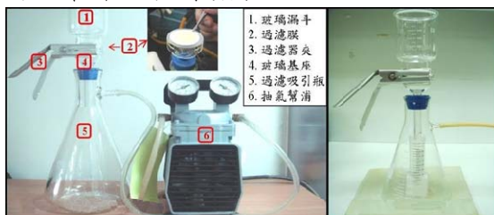
圖二、水檢體過濾裝置 圖三、檢液收集裝置

取檢體 100~1000 mL，加入氯化鎂(最終濃度 25 mM)，設置一水檢體過濾裝置(如圖二)，將檢體加入過濾漏斗中，經由真空抽氣，將檢體通過無菌濾膜，以 0.5 mM 硫酸溶液 200 mL 沖洗濾膜，棄沖洗液，置換過濾吸引瓶成檢液收集裝置(如圖三)，再以 1 mM 氫氧化鈉溶液 10 mL 洗滌濾膜，收集洗滌液至檢液收集裝置內之無菌離心管中，該離心管預先加入 50 mM 硫酸溶液 0.1 mL 及 100 倍三羥甲基胺基甲烷-乙二胺四乙酸溶液 0.1 mL，取出離心管，將洗滌液倒入離心過濾管過濾槽中，於 4°C 以 3000×g 離心 20~30 分鐘，濃縮至約 0.5 mL 以下，將濃縮液吸取至 1.5 mL 微量離心管中，供作檢液。