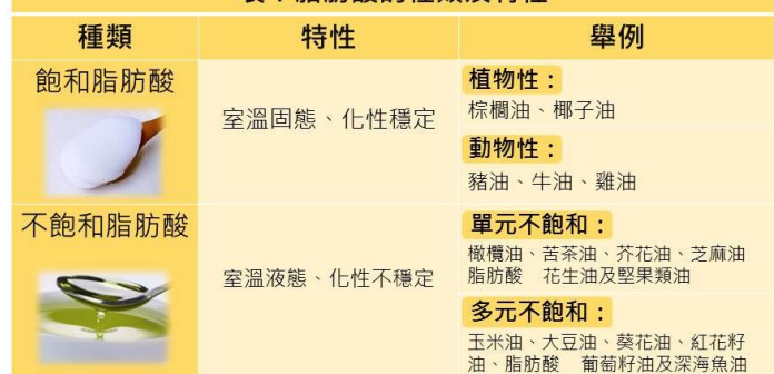
表：脂肪酸的種類及特性